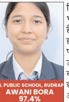
N. PUBLIC SCHOOL, RUDRAP AWANI BORA 97.4%

शिक्षण पद्धति को भी दर्शाती है। परिणाम घोषित होते ही विद्यालय परिसर में खुशी और उत्साह का माहौल बन गया। छात्र-छात्राओं एवं उनके अभिभावकों ने विद्यालय पहुंचकर इस सफलता का जश्न मनाया तथा शिक्षकों का आभार व्यक्त किया। इस अवसर पर विद्यालय प्रबंधन ने सभी सफल छात्रों एवं उनके अभिभावकों को हार्दिक बधाई दी। प्रबंधन ने कहा कि यह उपलब्धि छात्रों की लगन, शिक्षकों की समर्पित मेहनत और अभिभावकों के सहयोग का संयुक्त परिणाम है। विद्यालय भविष्य में भी इसी प्रकार उत्कृष्ट परिणाम देने के लिए प्रतिबद्ध है। आर.ए.एन. पब्लिक स्कूल सदैव छात्रों के सर्वांगीण विकास एवं शैक्षिक उत्कृष्टता के लिए समर्पित रहेगा।